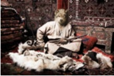
„My Brother is My Enemy“ von Shaarbek Amankul, 2017.

BURGRIEDEN. Noch bis 3. Mai zeigt das Museum Villa Rot die Ausstellung „Wald. Wolf. Wildnis“. Die Rückkehr des Wolfs in unsere Wälder ist aktuell in aller Munde und lässt so manchen erschauern. Laut einem Bericht des Bundesamtes für Naturschutz sollen aktuell mehr als 100 Rudel in Deutschland leben. Eigentlich ist das ein positives Zeichen eines sich erholenden Ökosystems. Doch die Vorstellungen von der blutrünstigen und hinterlistigen Bestie scheinen tief in uns verwurzelt.