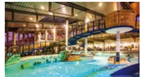
Atmosphärisch: Die Donaubad Halle bei Nacht.

Zeit für Ruhe&Entspannung finden sie in der Saunalandschaft. Eingehetzt wird in Finnischer-, Vier-Jahreszeiten-, Sudhaus-, Blockhaus-, Müns-terblick- und Biosauna. Neben Dampfbad, Meditationsraum und Entspannungsbecken gibt es tolle weitere Angebote, wie zum Beispiel die monatlichen Saunaabende mit Motto oder das Entspannungsprogramm mit Yoga und Autogenem Training. Ein weiteres Highlight sind die ständig wechselnden Dampfbadanwendungen/-peelings.