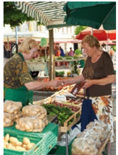
Bad Buchau bietet die Kulisse für einen Bummel über den Wochenmarkt.