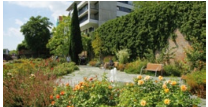
Der Ulmer Rosengarten lohnt einen Besuch.

Doch was macht das Besondere der Rose aus? Seit über 2000 Jahren wer-