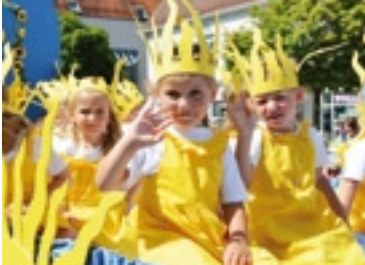
Der Festumzug lässt Kinder strahlen.

BAD BUCHAU. Vom 15. bis 18. Juni feiern die Bad Buchauer das traditionelle Adelindisfest. Es geht zurück auf die schwäbische Volksheilige Adelindis. Nachdem ihr Gemahl samt den drei Söhnen einer Bluttat im Plankental zum Opfer fiel, trat Adelindis ins Kloster Buchau ein. Dort wirkte sie als Wohltäterin für Notleidende und machte dem Kloster reiche Zuwendungen aus ihrem gräflichen Vermögen.