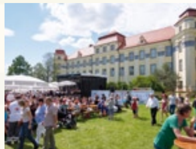
Feiern auf dem Festplatz im Schlosspark.

TETTANANG. Von 29. Juni bis 1. Juli begeistert das Kinder- und Heimatfest wie schon seit Jahren wieder mit einem bunten Rahmenprogramm alle Bürgerinnen und Bürger sowie Besucher.