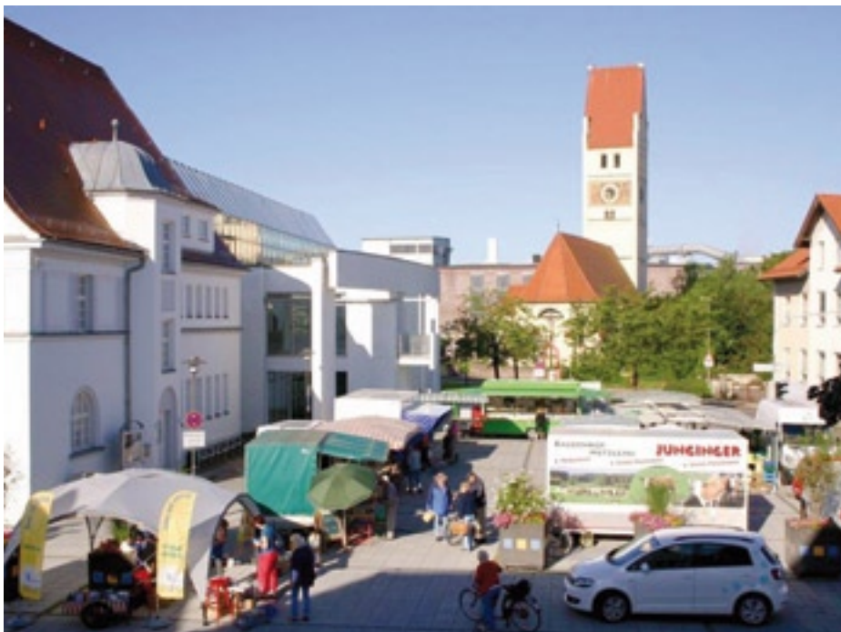
Samstags ist Wochenmarkt auf dem Hettstedter Platz in Vöhringen.

Zusammen mit Senden verbindet Vöhringen auch den jahrelangen Ärger um den Waldbaggersee. Dieser zwischen Illerzell und Senden gelegene Baggersee ist beliebt – auch bei Nudisten. Dies alleine wäre nun freilich kaum berichtenswert, wenn sich unter den Nudisten in den vergangenen Jahren nicht auch Swinger getummelt hätten,