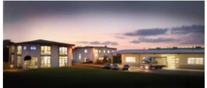
Der Sitz des Unternehmens Schnarrenberger in Vöhringen.