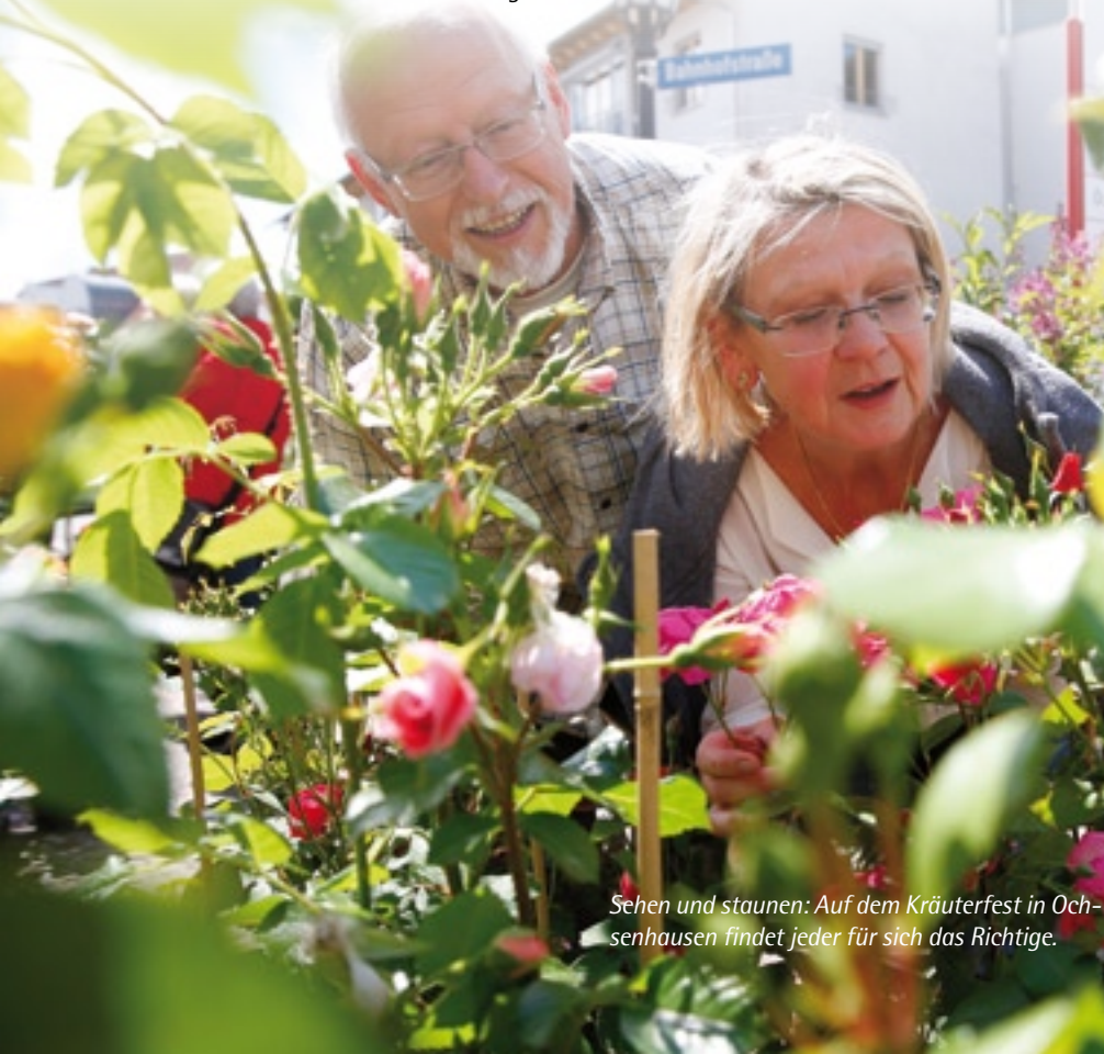
Sehen und staunen: Auf dem Kräuterfest in Ochsenhausen findet jeder für sich das Richtige.

Im Musiksaal der Schranne wird es wieder informative Vorträge rund um das Thema Kräuter geben. Dabei wird besonders auf deren Bedeutung für die Gesundheit sowie als Heilmittel und Zutat für die Küche eingegangen. Wer die heimische Kräutervielfalt hautnah kennenlernen möchte, kann an der beliebten Kräuterwanderung teilnehmen. Die Allgäuer Kräuterfrauen präsentieren für interessierte Besucher ihre umfangreiche Sammlung getrockneter Kräuter, sogenannte Herbarien, im Rathaus.