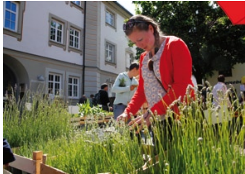
In entspannter Atmosphäre erwartet die Besucher eine reichhaltige Auswahl an Kräuter- und Gemüsepflanzen.

Für das leibliche Wohl der Besucher wird durch eine abwechslungsreiche kulinarische Verpflegung mit verschiedenen Gerichten und Erfrischungsgetränken aus der Kräuterküche gesorgt. Zudem können die Besucher des Kräuterfestes dieses Mal Bierbrauern über die Schulter schauen und eine der flüssigen Köstlichkeiten aus Hopfen und Malz im Anschluss genießen. Darüber hinaus bietet ein musikalisches Rahmenprogramm Unterhaltung für die Gäste. Der Ochsenhausener Kabarettist und Lyriker Franz Oxi Baur präsentiert am Stadtbrunnen Ausschnitte aus seinem Theaterprogramm. Für die kleinen Besucher halten der Naturschutzbund Deutschland (NABU) sowie der städtische Kindergarten Ochsenhausen zahlreiche Überraschungen bereit.