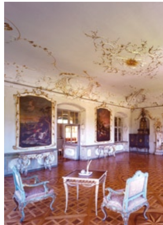
Das Empfangszimmer in der Prälatur im Rokostil wirkt eher verspielt als pompös.

Tipp: Ab Saisonbeginn erwartet ein neuer Abenteuerspielplatz unsere kleinen Gäste.