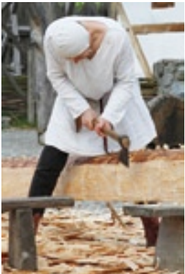
Hier werden Balken auf traditionelle Weise behauen.

KANZACH. „Bauarbeiten wie im Mittelalter“ stehen im Fokus, wenn zu Ostern wieder der Mittelalterverein „Die Reiseceen e. V.“ die Burg belebt. Ausgerüstet mit Behaubeil und Senkblei werden tatkräftig Balken behauen und andere wichtige Arbeiten vollbracht.