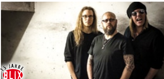
Mit BLIX abrocken: BLIX verlost 2 x 2 Karten für „Ohrenfeindt“ im Kaminwerk Memmingen.