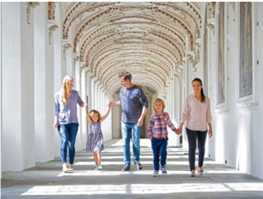
Auch für Kinder und Familien gibt es in Schloss Salem viel zu lernen, erleben und bestaunen.

tergründe und kunsthistorische Zusammenhänge und zeigen prachtvoll ausgestattete Innenräume.