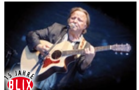
Möchten Sie einen ganz besonderen Abend mit Axel Prahl verbringen? BLIX verlost 2 x 2 Freikarten des Filmfestspiele e.V. für das Konzert in der Gigelberghalle.

Axel Prahl bekam als Achtjähriger seine erste Gitarre. Als Dreizehnjähriger träumte er davon, mal eine Schallplatte zu machen. Als junger Mann versucht er sein Glück mit einem Musikstudium auf Lehramt in Kiel, um es dann doch zunächst lieber als Straßenmusikant in Spanien finden zu wollen. 2010 holte er an seinem Küchentisch in Berlin seine Gitarre hervor, um seinen Gästen einige Songskizzen vorzustellen. Schließlich bringt Axel Prahl, 51-jährig, sein erstes Album heraus: „Blick aufs Mehr“. Prahl räsoniert mit „Blick aufs Mehr“ und randaliert als „Cosmopolitano“, säuselt und seufzt „Wieso bist Du immer noch da?“. Er ist bissig „Bla Bla Bla“, bis blauäugig brav, rührt, „Schön, dass du da bist“, verführt und taucht seine Zuhörer als „Wilde Welle“ in ein höchst vergnügliches Wechselbad der Gefühle, welches ganz am Ende sogar noch Platz für investigative Momente lässt. ► www.filmfest-biberach.de