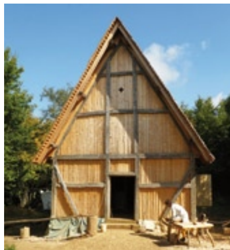
Die Holzkirche ist das aktuell größte Gebäude auf dem Gelände.

Wie wäre es mit einer Reise zurück ins Mittelalter? BLIX verlost 5 Familienkarten für einen Besuch von Campus Galli.