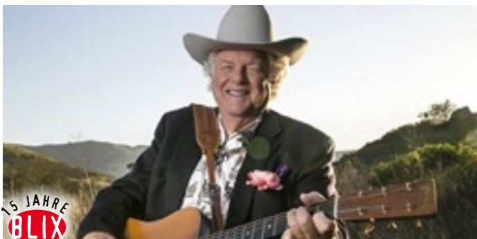
Möchten auch Sie Peter Rowan und Red Wine live erleben? Kein Problem! BLIX verlost 2 x 2 Karten für das Konzert in Biberach.

Ihre ersten Auftritte in und um Biberach hatte das Quartett bereits in den frühen 1990er Jahren, damals noch mit Gründungsmitglied Beppe Gambetta an der Gitarre. Die 1978 gegründete Band Red Wine gehört mit zum Besten, das dieses Genre in Europa zu bieten hat. Seit 1995 tourt Red Wine auch regelmäßig mit großem Erfolg in der Heimat der Bluegrass-Musik, in den USA, und trat dort, wie auch in Europa, bei nahezu allen Festivals mit Rang und Namen auf. Der Singer-Songwriter Peter Rowan blickt auf eine über 50-jährige Profikarriere zurück. Mit David Grisman gründete er die Band Earth Opera, die auch als Vorgruppe der Doors bekannt wurde. ► www.kartenservice-biberach.de