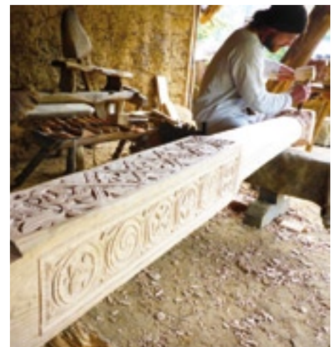
Das Holz wird von geübten Zimmerleuten mitunter kunstvoll bearbeitet.