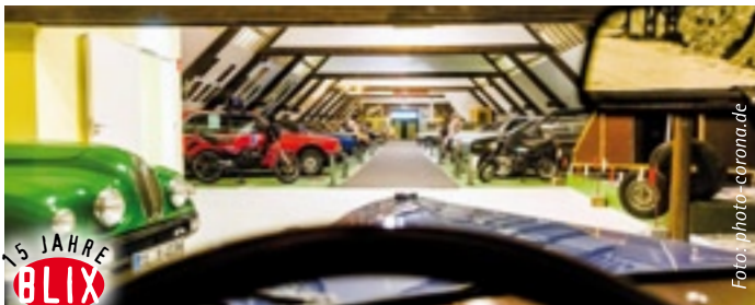
Oldtimer-Fans aufgepasst: BLIX verlost 3 x 2 Eintrittskarten.

Veranstaltungen und Führungen unter ► www.automuseum-wolfegg.de