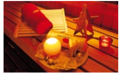
In der Saunalandschaft erwartet Besucher, passend zur Jahreszeit, weihnachtliches Ambiente.

16. Dezember findet das Finale statt. Am 27. Januar und in den Winterferien wird wieder ein Ferienspaß mit Spielgeräten und Wassertieren im Nichtschwimmerbecken bereitgestellt. Das Osterfest wird am 31. März im Hallenbad mit einem Festspieltag in beiden Becken gefeiert. Auch in dieser Saison wird wieder ein abwechslungsreiches Sauna-Event-Programm angeboten. Los geht es vom 30. Oktober bis zum 5. November mit der exklusiven „Lass-Dich-Verwöhnen-