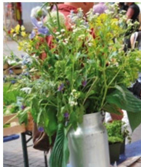
Hier finden Besucher Pflanzen, Kräuter, Gemüse und vieles mehr in bunter Vielfalt.