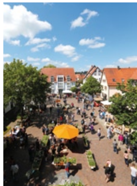
Am 27. Mai verwandelt sich die Ochsenhausener Innenstadt in ein duftendes Kräuterparadies.

Da die Kräuterwanderung mit Bernhard Allgauer auch im letzten Jahr großen Zuspruch fand, wird es dieses Jahr gleich zwei Touren geben. Vormittags und nachmittags können Inter-