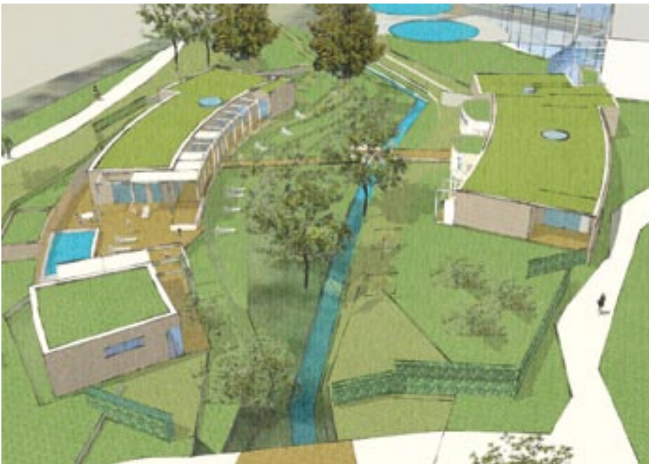
Neue Sauna- und Wellnesslandschaft

Im neuen Medical Wellness Bereich wird Gesundheit und Wohlbefinden basierend auf Jahrhunderte lange Tradition, angereichert um moderne Erkenntnisse der Therapie, gelebt. Für