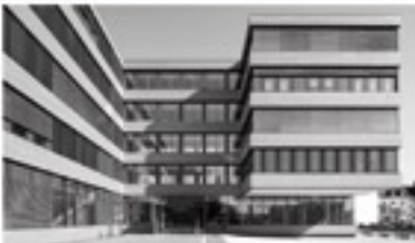
Kanzlei Ulm, Korntstraße 3, 89073 Ulm