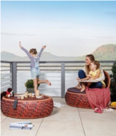
Dank Leeb Alu Comfort Plus®-Beschichtung drei Mal so witterungsbeständig.

Gratiskatalog und Infos unter der gebührenfreien Hotline 0800-1801003 oder ► www.leeb-balkone.com