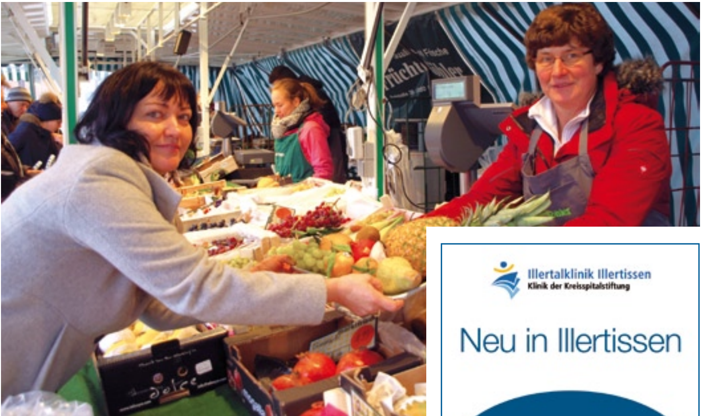
Frisches Obst wechselt auf dem Illertissener Wochenmarkt den Besitzer.

➤ der Gebäude, kann jedoch auf Zuschüsse u.a. von Schulwerk und Landkreis hoffen. Und dann die Iller: Bayern und Baden-Württemberg wollen den Grenzfluss für 70 Millionen Euro zwischen Neu-Ulm und Aitrach binnen zehn Jahren ökologisch aufwerten – und damit auch den Streckenabschnitt auf Illertissener Gemarkung. Schneller voran geht der Umbau des Heimatmuseums im Vöhlinschloss; bereits im Frühjahr will der Heimatverein nach fünf Jahren Pause das neue „Museum Illertissen – Geschichten und Geschichte im Schloss“ wieder eröffnen, auf dem aktuellen Stand der Museumsdidaktik, mit modernster Technik und in Ergänzung zum benachbarten Bayerischen Bienenmuseum. Ebenfalls im Frühjahr wird der bereits im Entstehen begriffene Duftkreisgarten als Pendant zum Farbkreisgarten des Vereins der Förderer der Gartenkultur wieder Gäste nach Illertissen anlocken; die Vöhlinstadt kann weiterhin mit einem Museum der Gartenkultur aufwarten.