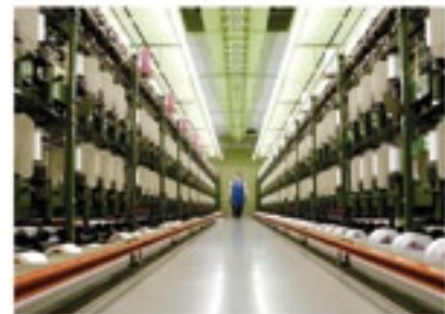
Die Auszubildenden arbeiten an modernen Maschinen mit hohem technischen Standard.

nur Arbeit, sondern auch vielfältige Perspektiven. Produktionsmechaniker Textil sorgen in der Herstellung von Garnen, gewebten Stoffen, textilen Bändern oder Verbundstoffen für einwandfrei funktionierende Produktionsanlagen sowie störungsfreie und wirtschaftliche Arbeitsabläufe. Die Ausbildung erfolgt an den Standorten Simmerberg und Illertissen. Produktveredler Textil werden ausschließlich am Standort Illertissen ausgebildet. Der Ausbildungsberuf des Industriekaufmanns wird in Weiler-Simmerberg ausgebildet. Die Auszubildenden durchlaufen während ihrer Ausbildungszeit alle kaufmännischen Abteilungen.