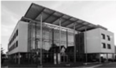
Kanzlei Illertissen, Marktplatz 20, 89257 Illertissen

Wir sind eine überregional tätige Rechtsanwaltskanzlei mit den Schwerpunkten EDV- und Internetrecht, Arbeitsrecht, Marken- und Wettbewerbsrecht, Förderungsmanagement, Vertriebs- und Wirtschaftsrecht.