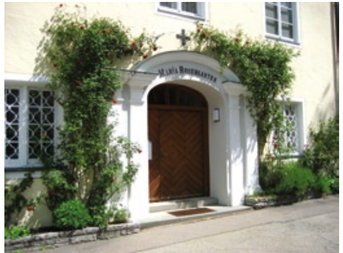
Frisch saniert lädt das Kloster Maria Rosengarten zu einem Besuch ein.